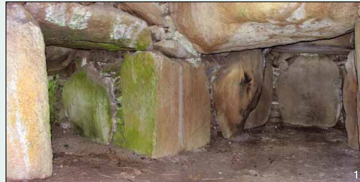
Milehøj-jættestuen er et imponerende bygningsværk som vidner om stor arkitektonisk indsigt. De store bære- og dæksten danner sammen med indskudte sten og opstabilede tømure af flade sten og den ydre høj med stenpakninger et forseglende og tæt gravkammer.