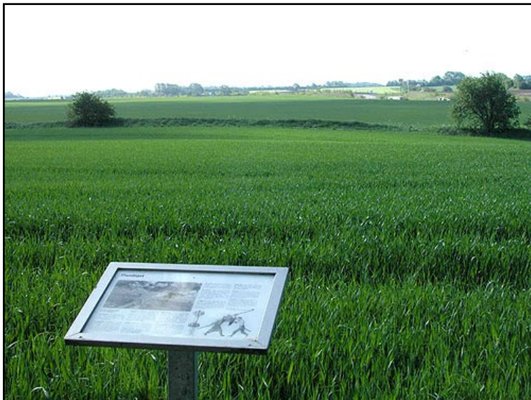
Illustr.1 Dandiget set fra holdepladsen ved den nu afskårne Ejstrupvej.