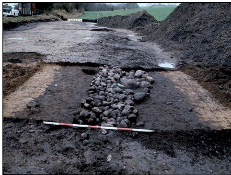
Illustr.4 Snit gennem stenlægningen i den nordlige af de to grøfter som flankerede Dandiget.