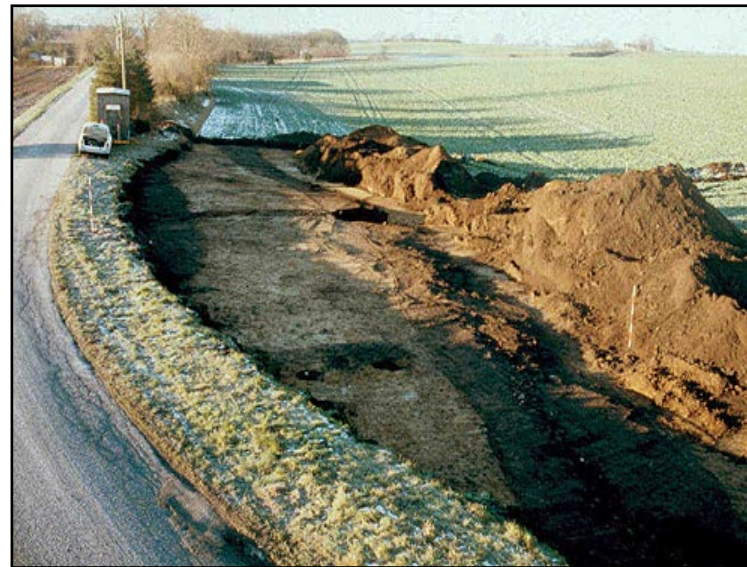
Illustr.3 Undergrundens spor efter Dandiget ved udgravningerne i 1991.