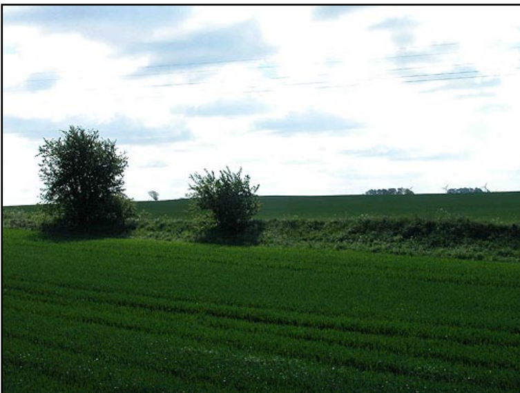
Illustr.2 Oprindeligt har Dandiget været næsten 1,5 km. langt.