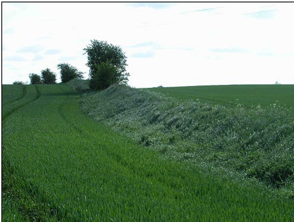
Dandiget - i dag et stort marksskel - set fra vest.

Dandiget er en såkaldt folkevold fra den tidlige jernalder omkring år 0. I dag er der bevaret en ca. 1,2 km lang strækning af det jordopbyggede dige, der er indtil 2 meter højt. Diget ligner nu i modsætning til tidligere mest et højt skeldige mellem de opdyrkede marker (Se illustration 1). Nu danner diget sogneskel mellem Fårup og Asferg sogn og i østenden udgør det grænsen mellem Ejstrup og Asferg bys jorder.