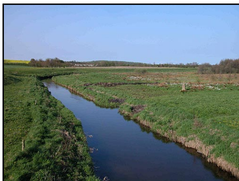
Illustr.1 Sjelbro-stenen i engen ved Alling Å set fra nutidens landevejsbro øst for stenen.