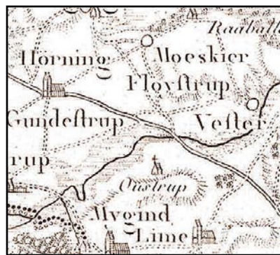
Illustr.9 1700-tals vejen nord for Sjelbro gik over Hørning. Fundene ved Hørning Kirke indikerer, at vikingetidsvejen havde samme forløb.