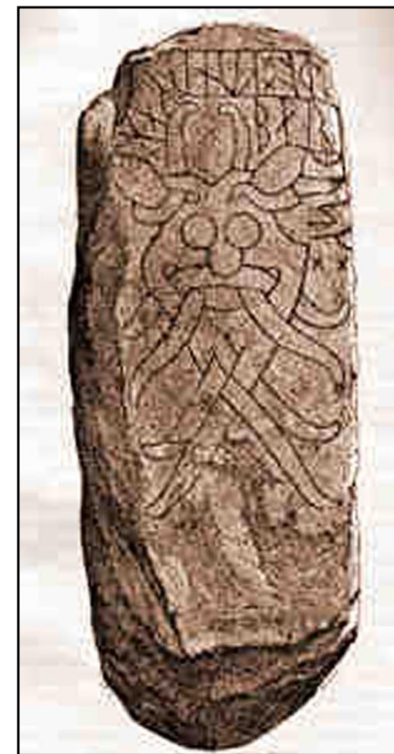
Illustr.7 Maskebilledet på Århus-runestenen.