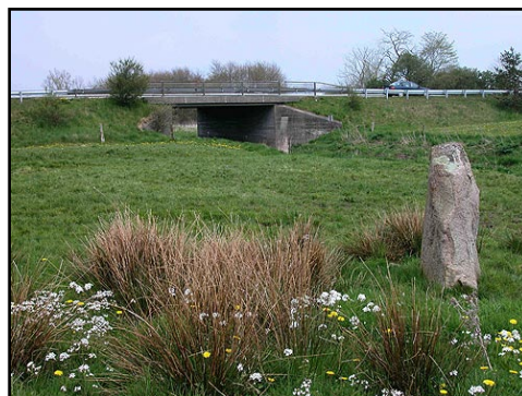
Illustr.2 Maskestenen set fra nordvest.