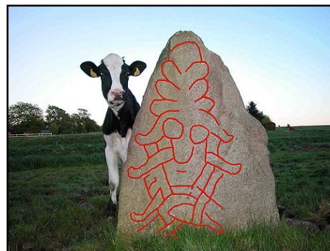
Illustr.6a Opstregning af det indhuggede maskebillede på Sjelbrostenen af den grufulde åmand.