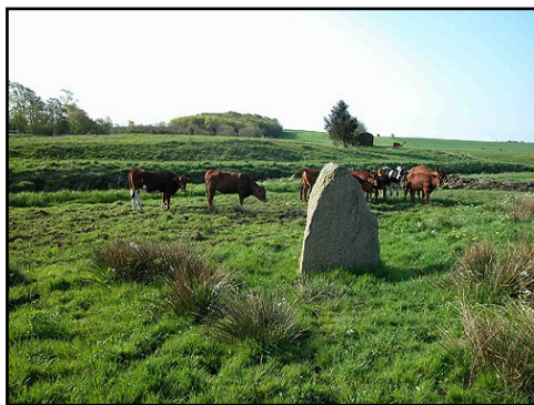
Illustr.8 Kreaturer afgræsser i dag fredeligt engen ved Sjelbro som stadig forsegler de velbevarede vejspor.