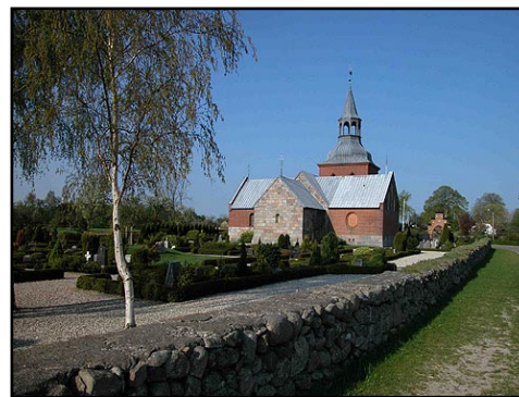
Illustr.10 Hørning Kirke lige nord for Sjelbro, hvor der allerede i vikingetiden omkring år 1000 blev bygget kirke.