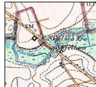
Illustr.4 På generalstabskortet fra slutningen af 1800-tallet fremgår Skjelbro Kro og dens stald tydeligt nær 2 mile-mærket fra Randers.