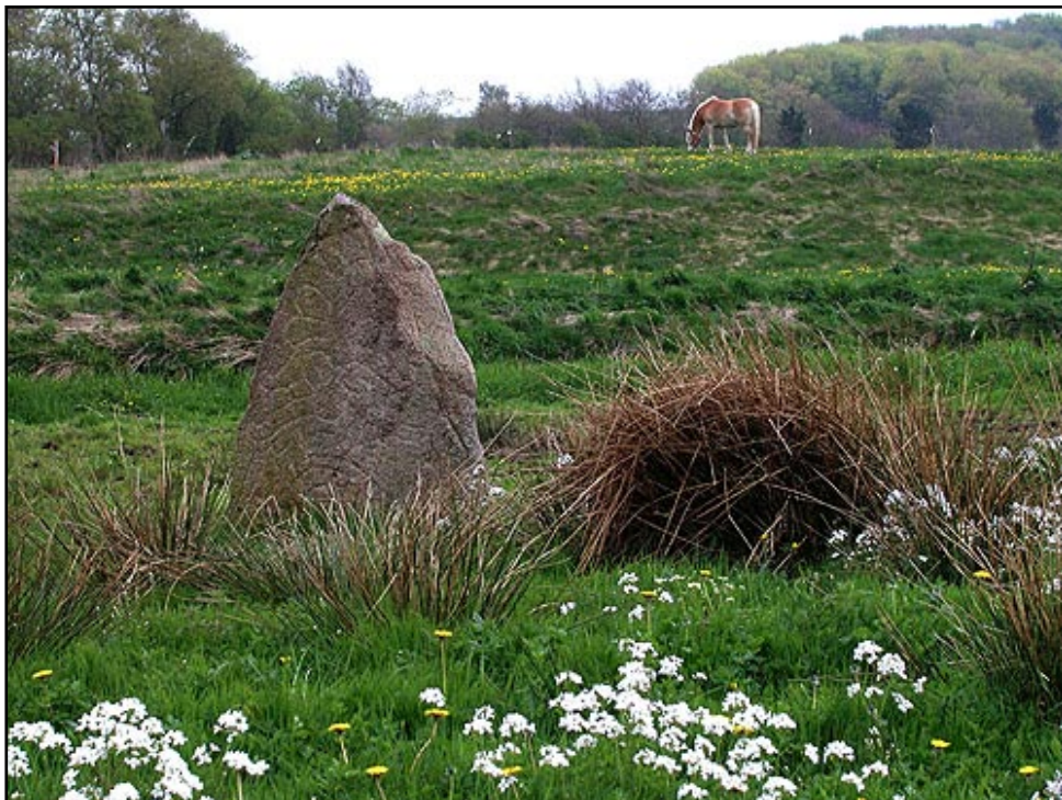
Sjelbro-stenen ved Alling Å markerer et mere end 2000 år gammelt overgangsted.

Det er vel kun de færreste mennesker som skænker stedet en særlig tanke, når Alling Å i dag krydses ad den moderne landevej og betonbro ved Sjelbro. Stedet er dog overordentligt interessant og rummer en god historie om uafbrudt færdsel gennem de sidste 2.000 år.