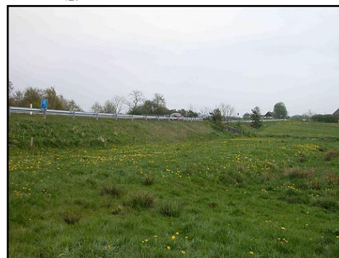
Illustr.3 I engen mellem Sjelbrostenen ses flere gamle vejdæmninger. Denne nærmest nutidens landevej er fra Chr. d. IV. Tid.