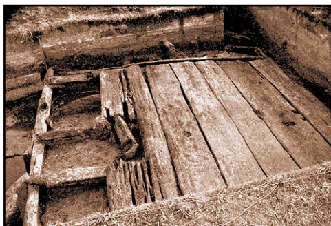
Illustr.5 -Udgravningsfoto af den øverste af vikingetidens 2 svelleveje som ligger ovenpå 2 stenlagte veje fra tidlig jernalder. (Foto T.G. Bibby, 1953).