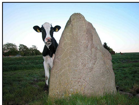
Illustr.6 Det indhuggede maskebillede på Sjelbrostenen af den grufulde åmand.