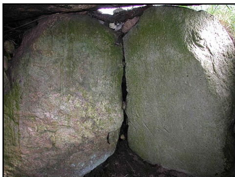
Illustr.5 De tæstillede bæresten i langdyssens gravkammer vender den flade side mod kammeret, og danner sammen med den store dæksten et helt forseglet rum.