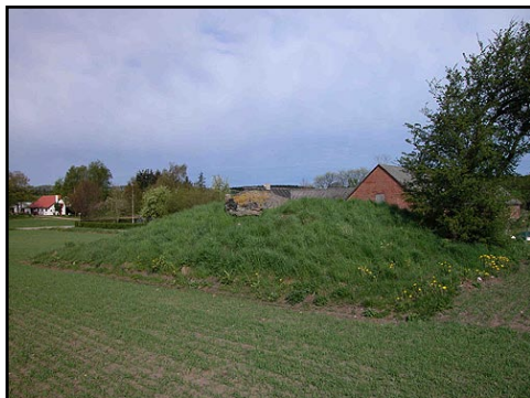
Illustr.1 Langdyssens gravkammer og gang forsegles stadig næsten helt af den omgivende jordhøj.