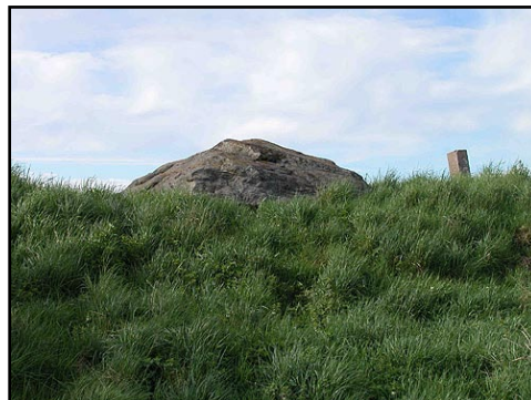
Illustr.2 Dækstenen over gravkammeret stikker kun lidt op over højen . Her set fra nord.