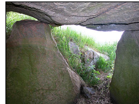
Illustr.4 Gravkammeret set indefra mod den tilstødende kammergang.