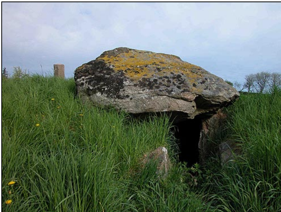
Gravkammeret og den tilstødende kammergang i Jyndovnen set fra syd.

Jyndovnen er en smuk langdysse fra bondestenalderen ved Godthåb lige nord for Ginnerup. Dyssen ligger i dag i et opdyrket kulturlandskab, men da den blev opført for mere end 5.000 år siden, lå den kun få hundrede meter nord for en meget smal fjordarm, som skar sig ca. ½ km ind i bakkerne fra nordsiden af Kolindsund ved Ginnerup.