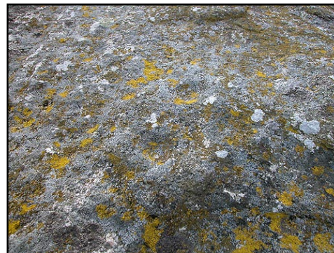
Illustr.3 De indhuggede skåltegn på dækstens overside som blev indhugget i bronzealderen (1.800 - 500 f.Kr.) tolkes som frugtbarhedssymboler.