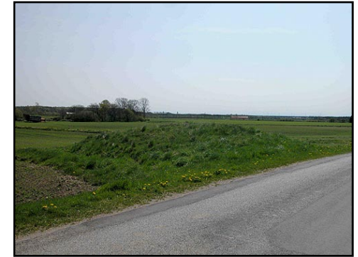
Illustr.8 Den lille og måske intakte runddysse ud til vejen overfor gården kort sydøst for langdyssen.