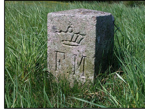
Illustr.3 Fredningsstenen på højen med indhugget kongekrone og "FM" for Fredet Mindesmærke.