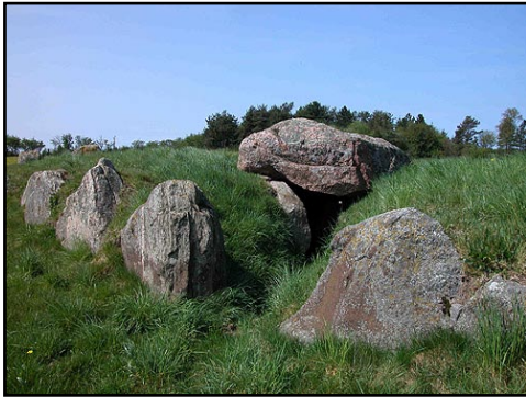
Illustr.5 Sydvest-kammeret dækkes stadig af en flot dæksten. Her set fra nordøst.