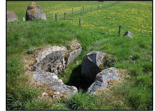
Illustr.4 Langdyssens nordøst-kammer set ovenfra og fra sydvest med tilstødende kammergang som udmunder ved randstenen til højre i billedet.