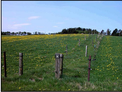
Illustr.1 Den afmærkede trampesti til langdyssen. Her set fra Sognevejen øst for dyssen.