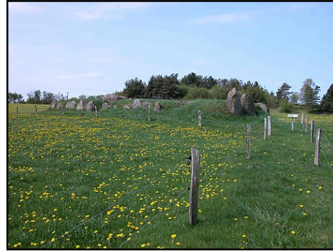
Illustr.2 Langdyssen med dens flotte randstenskæde set fra øst.