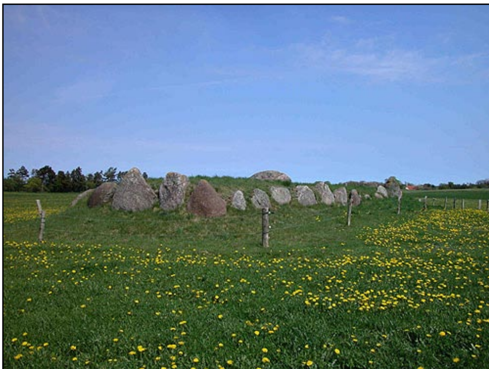
Den restaurerede "Ildbjerggård-langdyssen" er en af Djurslands flotteste langdysser. Her set fra sydøst.

I dag, mere end 5.000 år efter opførelsen, er Ildbjerggård-langdyssen stadig blandt de flotteste og mest seværdige storstensgrave fra bondestenalderens som findes i Århus amt. At dyssen fremstår så velbevaret skyldes også en delvis restaurering i 1957, hvorunder bl.a. flere udvæltede randsten omkring den 25 m lange og ca. 7,5 m brede langdyssen blev genrejst.