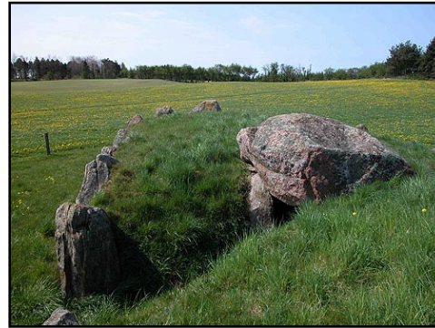
Illustr.6 Langdyssens jordhøj forsejler stadig næsten helt de to gravkamre.