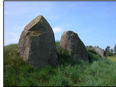
Illustr.7 Langdyssens store "Stævnsten" i nordøst-enden.