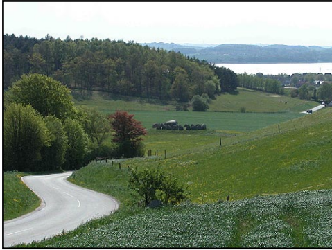
Illustr.1 Poskær Stenhus med Knebel Vig i baggrunden.