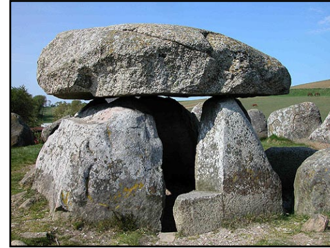
Illustr.3 Gravkammeret med afkløvet bæresten set fra syd.