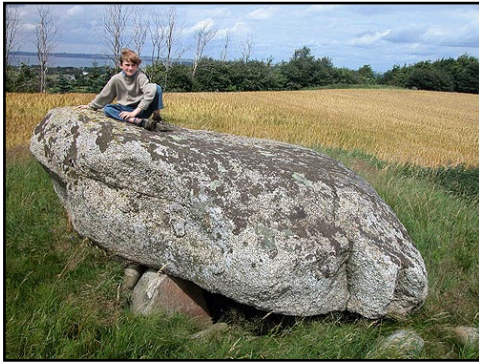
Illustr.5 På Grovlegård-dyssen nord for Poskær Stenhus ligger den anden halvdel af den store dæksten.