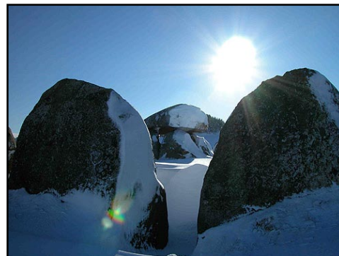
Illustr.10 Poskær Stenhus i vintersol.