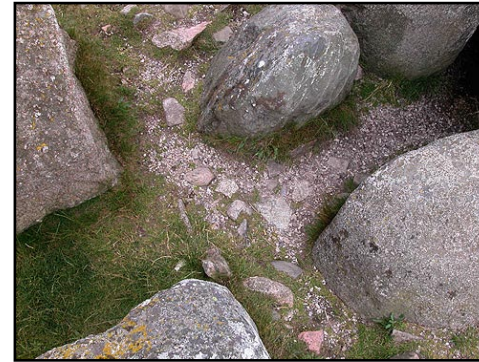
Illustr.7 Tærskelstenen i gangen til dyssen.