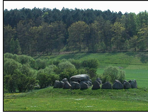
Illustr.2 Poskær Stenhus er Danmarks største runddyse.