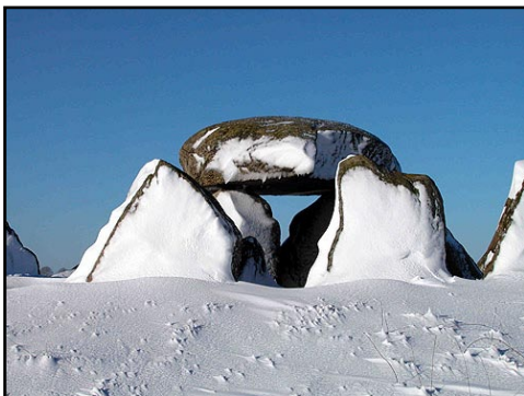
Illustr.9 Efter storm kommer sol - Vinterstemning efter snestormen vinteren 2002.