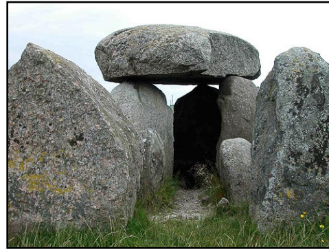
Illustr.6 Poskær-dyssens gang- og gravkammer set fra øst.