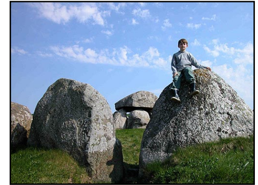
Illustr.8 Randstenskæden og dyssen set fra nord.