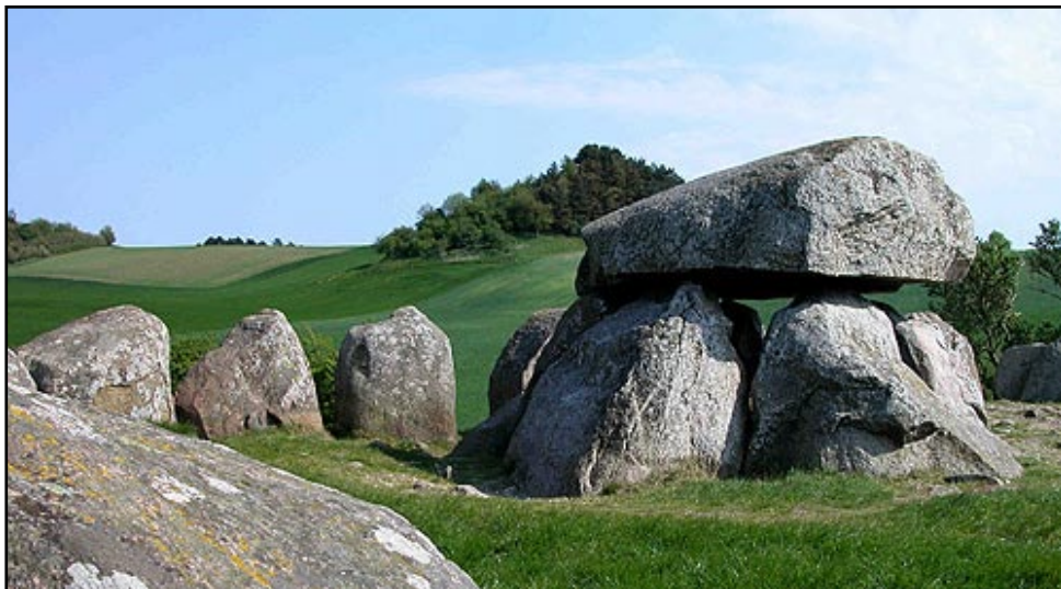
Poskær-dyssens maleriske gravkammer indenfor den store randstenskæde set fra nord

I det stærkt kuperede landskab på Mols ligger stendyssen Poskær Stenhus (Se illustration 1). Den er blandt de smukkeste og mest kendte stendysser vi har i Danmark. Dyssen blev opført i bondestenalderens såkaldte Tragtbægerkultur omkring 3.300 f. Kr., og har sikkert fungeret som en fælles grav- og kultplads for områdets bopladser.