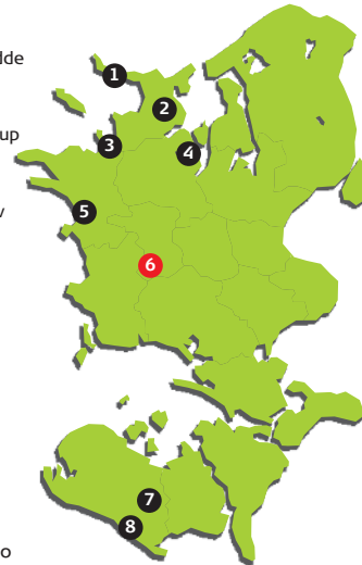
Layout: BJ IdeReklame