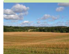
Udsigt fra bjerget