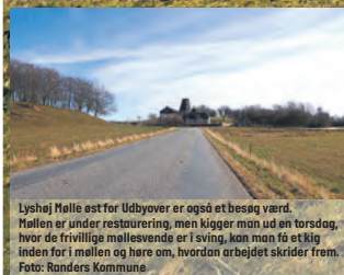
Lyshøj Mølle øst for Udbyøver er også et besøg værd. Møllen er under restaurering, men kigger man ud en torsdag, når de frivillige møllesvendene er i sving, kan man få et kig inden for i møllen og høre om, hvordan arbejdet skrider frem.