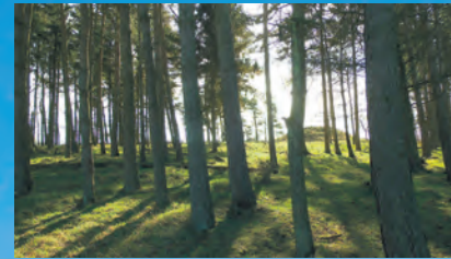
Toppen af den store bronzealdergravhøj er afgrævet i gammel tid, men der er formentlig stadig flere grave i højen.

Loven kom i sidste sekund og har været stærkt medvirkende til, at vi stadig kan opleve nogle af fortidens fantastiske monumenter.