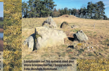
Langdyssen set fra sydvest mod den store bronzealderhøj i baggrunden.