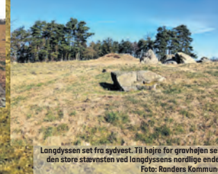
Langdyssen set fra sydvest. Til højre for gravhøjen ses den store stævsten ved langdysSENS nordlige ende.