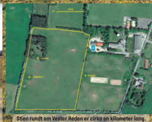
Stien rundt om Vester Heden er cirka en kilometer lang.