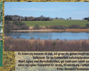
Er tiden og benene til det, så giver en gåtur rundt om Udbyøver Sø en fantastisk naturoplevelse. Start turen ved Havndalhallen, gå med uret rundt om søen og oplev fuglelivet til lands, til vands og i luften.