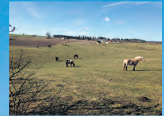
Fra Vester Hede er der god udsigt mod vest og hest.