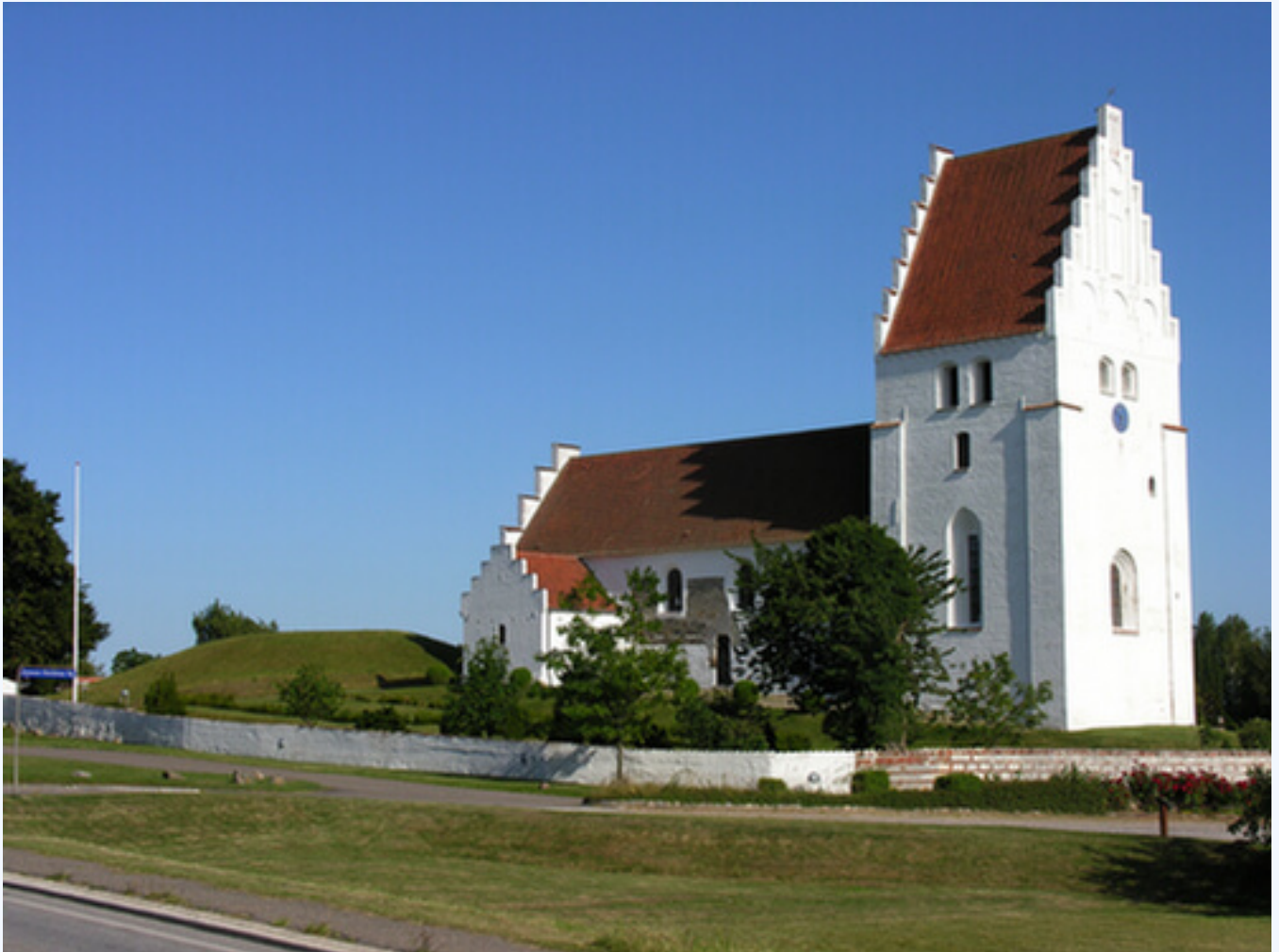
1: Elmelunde Kirke set fra nordvest med den store gravhøj på kirkegården lige øst for kirken.