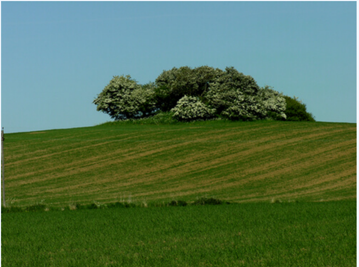
1: Målerhøj - en 3.500 år gammel gravhøj anlagt på top af bakken. Her set fra sydvest.