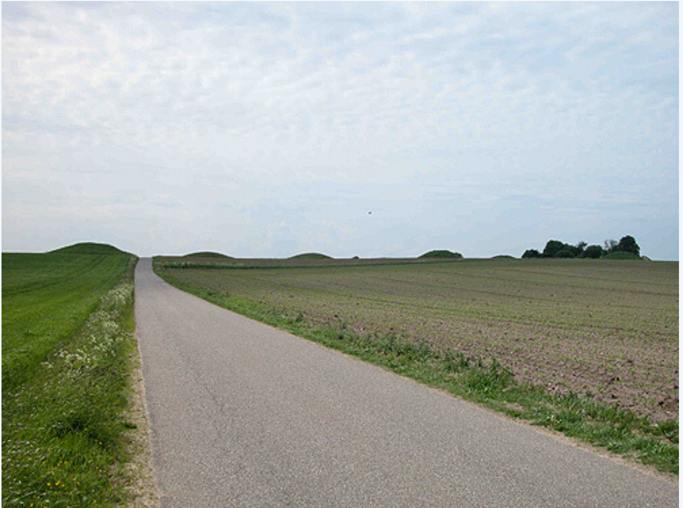
1: Vinding Ottehøje på bakketoppen 145 m.o.h. Her set fra nordøst.