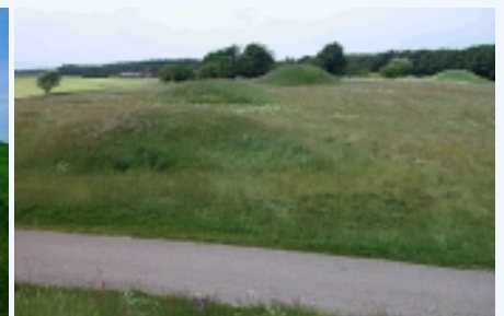
4: Bronzealderens gravhøje ligger samlet på gravpladser. Her de 3 høje nord for vejen.