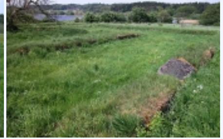
Klosterets østfløj med læsesalen og munkenes sovesal set fra sydøst.