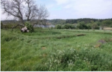
Klostertomten set fra sydøst. Græstørvsvoldene markerer klosterets mure.