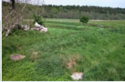
Klosterkirken lå i den sydlige fløj af det 4-fløjede kloster som omsluttede klostergården.