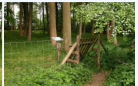
Stien fra P.-pladsen fører frem til hegnet i