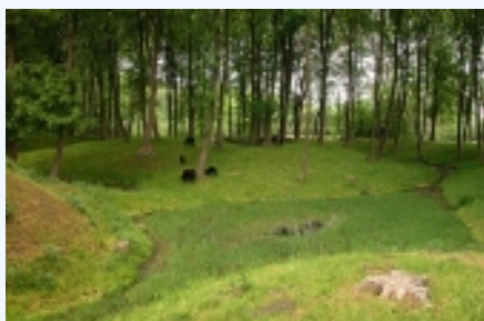
Fåregræsning sikrer voldstedets synlighed