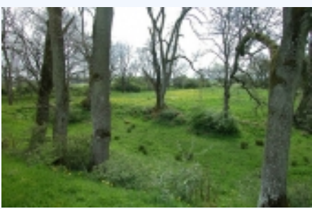
Hagsholm Voldsted set fra nordvest.