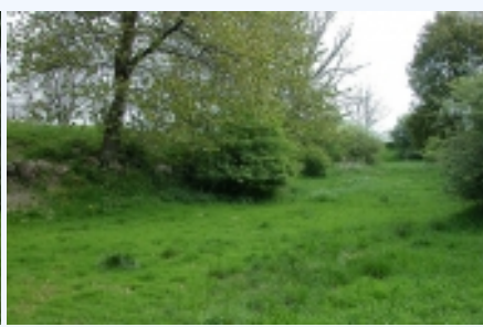
Den sydlige voldgrav set fra sydvest.