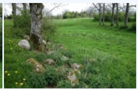
Østre voldgrav set fra den stensatte voldbanke.