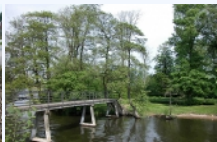
En gangbro fører over Gudenå til Slotsholmen.