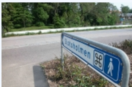
Henvisningsskiltet ved Viborgvej lige før Silkeborg Langsø.