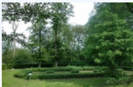
Slotsholmen med det markerede grundrids efter Århus-bispens stenhuse set fra vest.

Rekonstruktionstegning fra 1921 af det fuldt udbyggede Silkeborg Slot. Med grønt slotsholmen hvor grundridset af stenhuset nu er markeret.