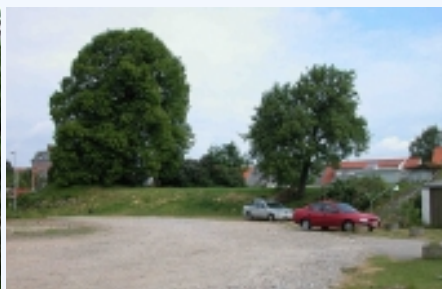
Det fredede stykke af Skanderborg byvold set fra sydvest. Infoskilt ved foden af byvolden mod sydvest. Oversigt over den fredede byvold set fra syd fra sydøst.