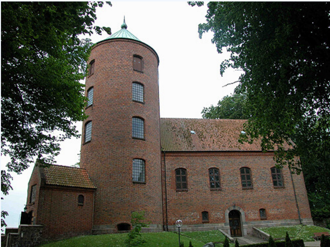
Skanderborg Slotskirke set fra øst.