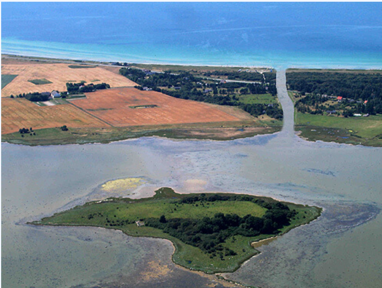
Den nu tørre Kanhavekanal set fra luften mod vest - og med "tilføjet" vand.