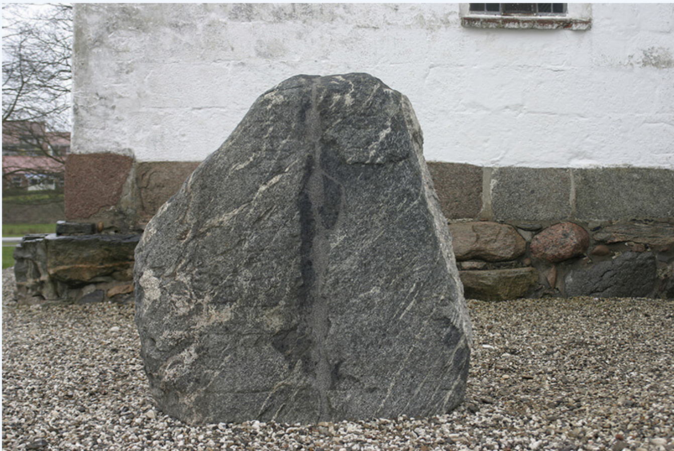
Langåstenen III efter restaurering og genrejsning 2015.