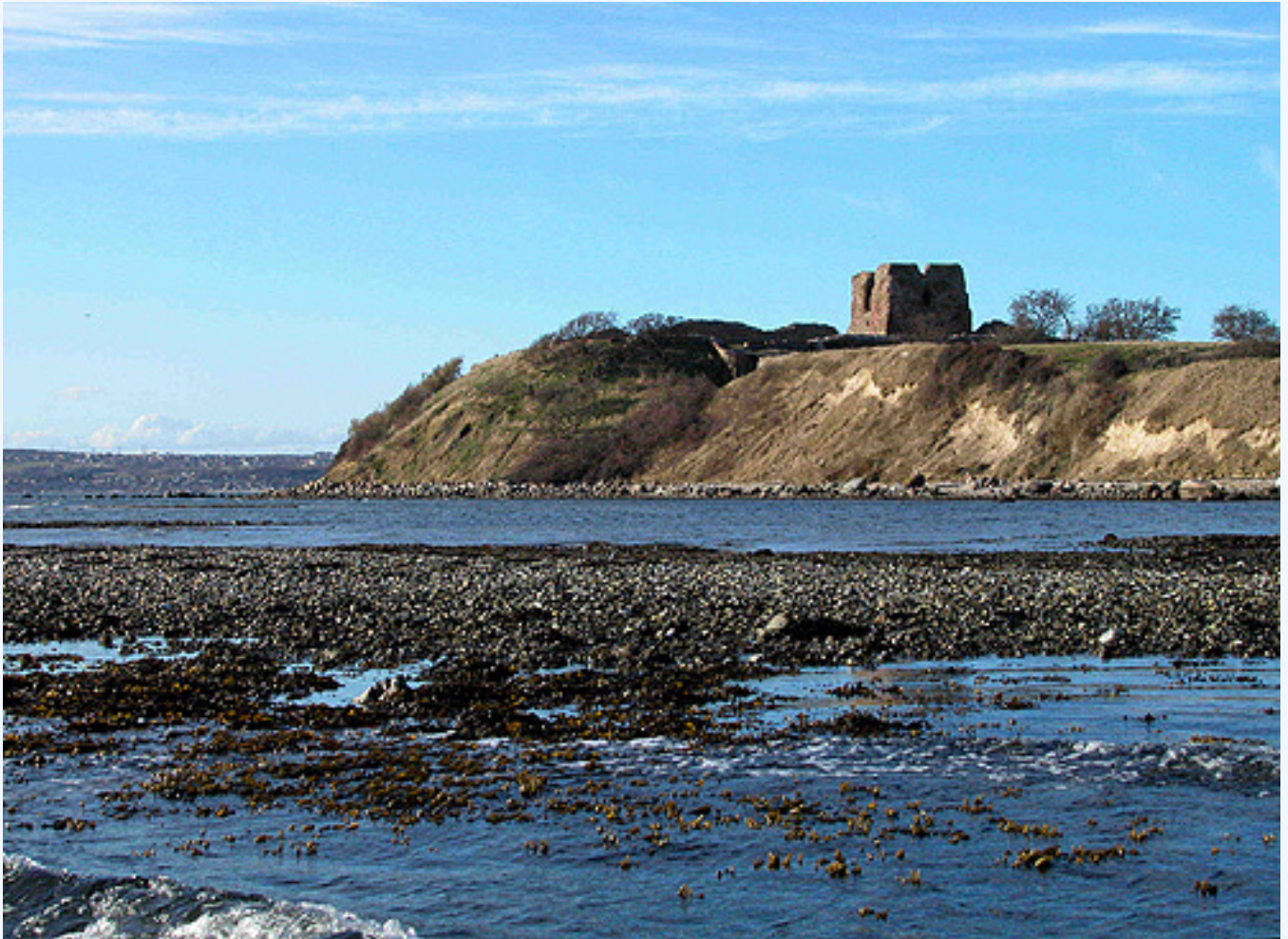
Kalø-ruinens tårn og ringmur set fra sydøst.