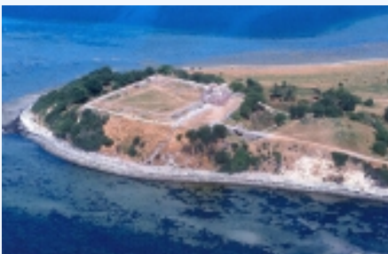
Luffoto af Kalø-borgen set fra syd.