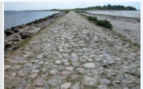
Den stenbrolagte og 500 m. lange vejdæmning til Kalø-borgen set fra nord.