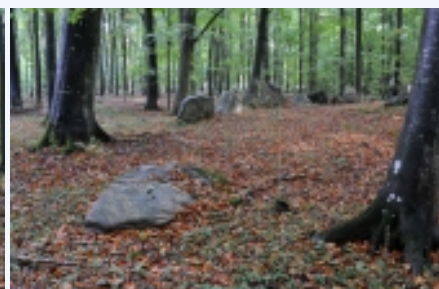
4: Væltet randsten eller sten fra et gravkammer midt i den afgravede høj set fra sydvest.