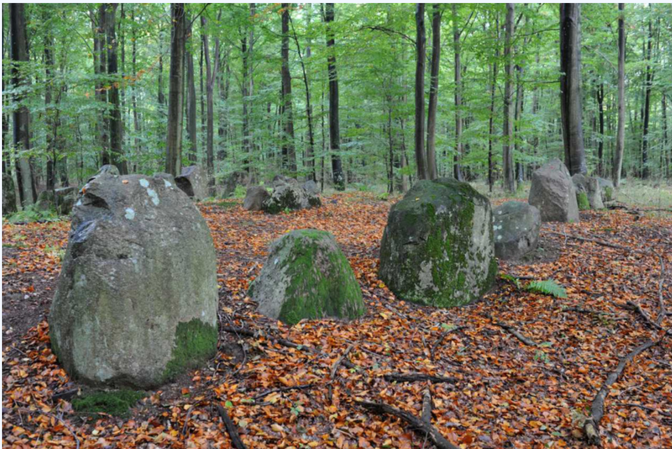
1: Store randsten langs nordsiden af Bulbro-langdyssen set fra nordøst. I højens midte ses afkløvede sten fra et gravkammer