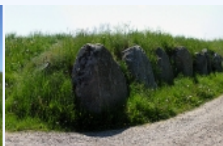
4: Panorama, Grønsalen set fra nordøst.