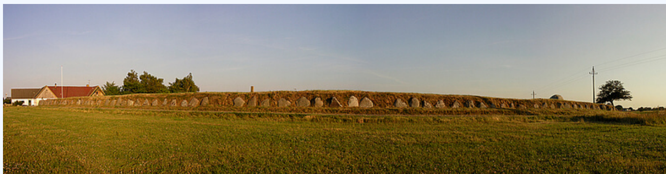
1: Panorama over Grønsalen med sin imponerende randstenskæde. Her set fra nord.