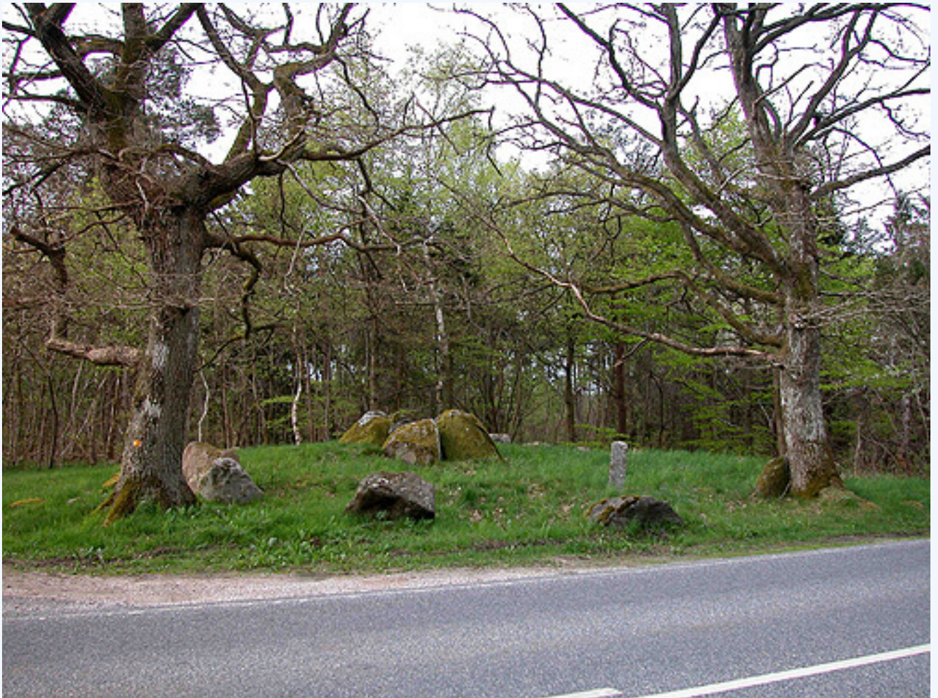
Den sydligste runddysse i Klemstrup Skov set fra nordøst.