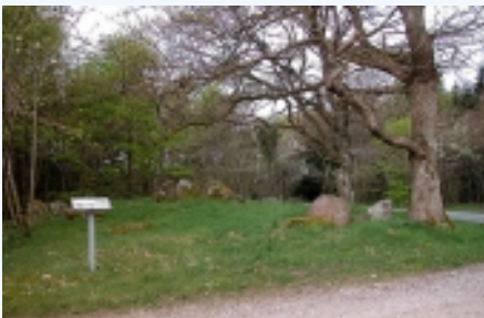
Informationsskiltet ved østsiden af runddysse.