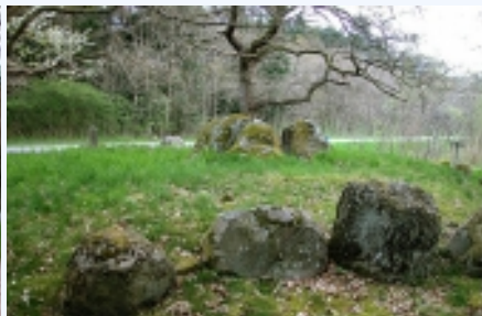
Randsten og gravkammer set fra sydvest.