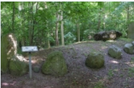
Langdysse set fra nord.

Marienborg langdysse i skoven nord for Marienborg Gods. Her set fra vest med den ejendommelige store bautasten i højens sydvestlige ende.