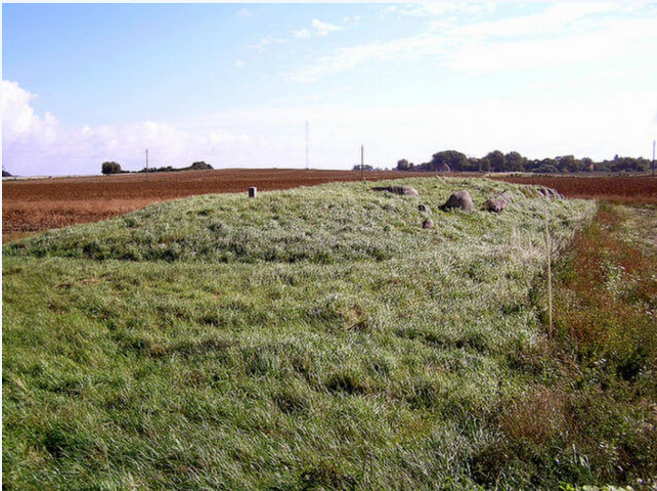
Langdysen "Nils Halses Høj" i ager set fra vest.