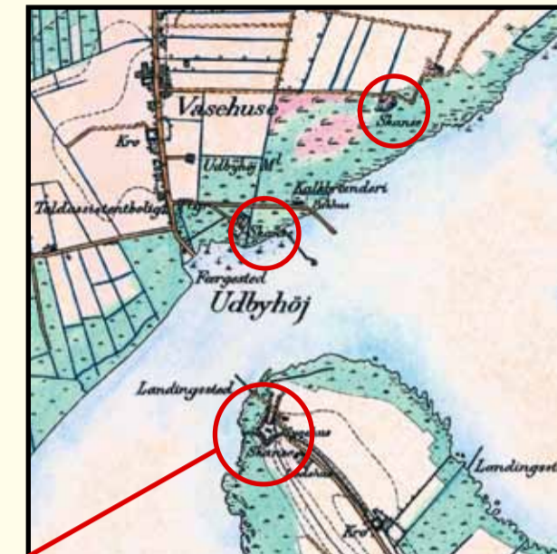
Englandskrigens tre skanser ved Udbyhøj. Til venstre generalstabskortet opmålt omkring 1870 og til højre et moderne luftfoto af området. Bemærk fjordens tydelige strømrende med dybt vand som giver et godt, men svært, sejløb. Kort © KMS. Luftfoto © COWI