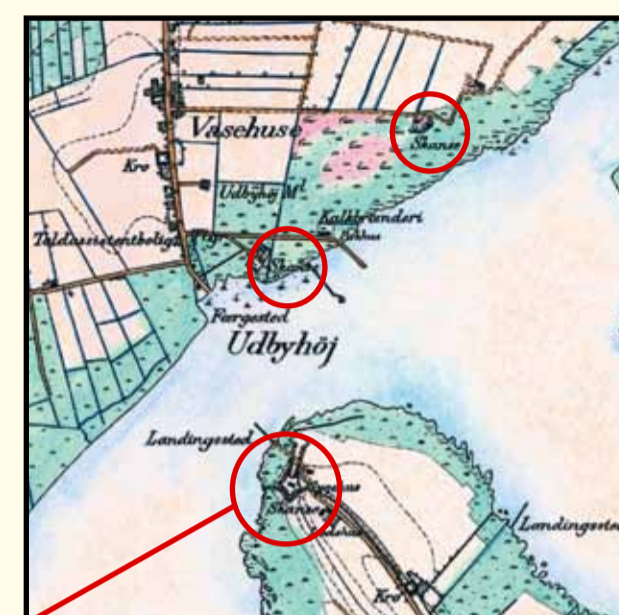
Englandskrigens tre skanser ved Udbyhøj. Til venstre generalstabskortet opmålt omkring 1870 og til højre et moderne luftfoto af området. Bemærk fjordens tydelige strømrende med dybt vand som giver et godt, men svært, sejløb. Kort © KMS. Luftfoto © COWI