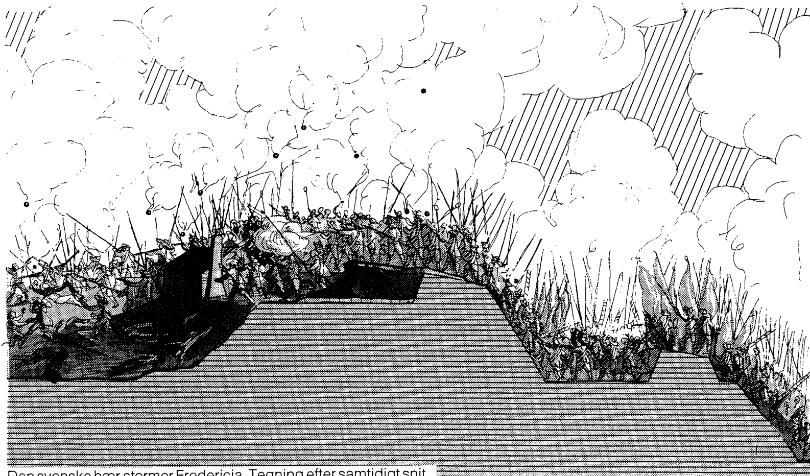
Den svenske hær stormer Fredericia. Tegning efter samtidigt snit.