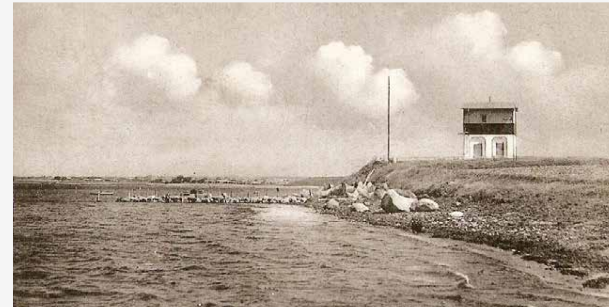
Bogø Fyr med træbygget overdel før 1922. Fra Kaj Woelkes postkortsamling

Det nu nedlagte Bogø Fyr vejledte gennem 90 år skibstrafikken gennem Storstrømmen og "Sortsø Gab" og videre mod syd til Grønsund. Fyret blev opført i 1895 og frem til 1922 var fyrets øvre del bygget i træ. Herefter blev fyret forhøjet med den nuværende murbyggede overdel. En gasbrænder og et spejlapparat forsynede fyret med lys indtil 1918, hvor det blev udskiftet med et linseapparat. Fyret var i drift frem til 1985, hvor ledelys på Farøbroen overtog fyrtjensten.