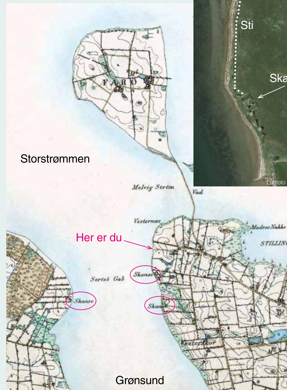
Kort: KMS ©