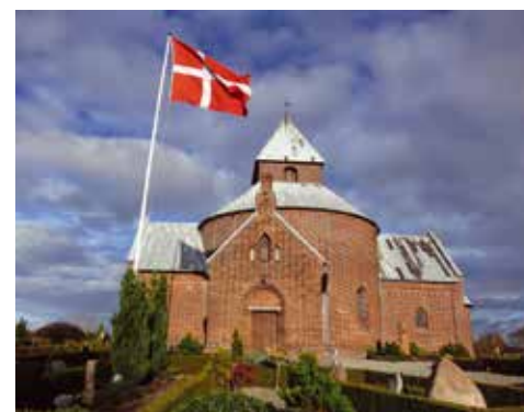
Thorsager Kirke, Djursland.

Rundkirkerne er typisk en kombination af forsvarsværk og kirke - opført med kongens tilladelse.