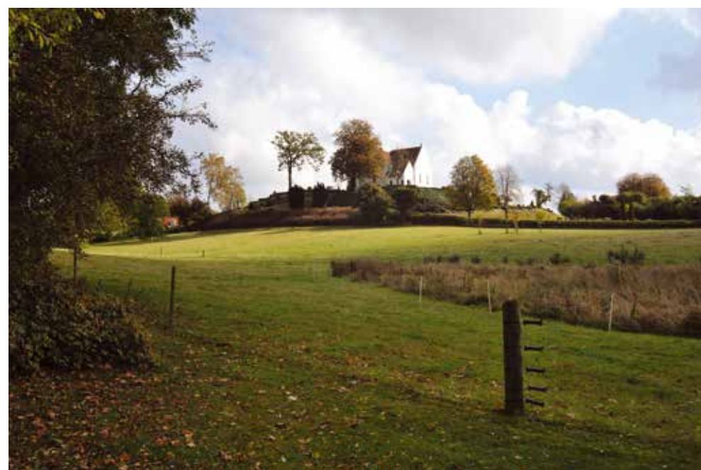
Fra søen og volden mod sydvest fornemmes det store areal med Præsteengen og borgbanken - som halvkredsvolden omslutter tydeligt.

sydøstre side opføres en række driftsbygninger til den nye avlsgård. Den sydlige vold blev også erstattet med en ringmur.