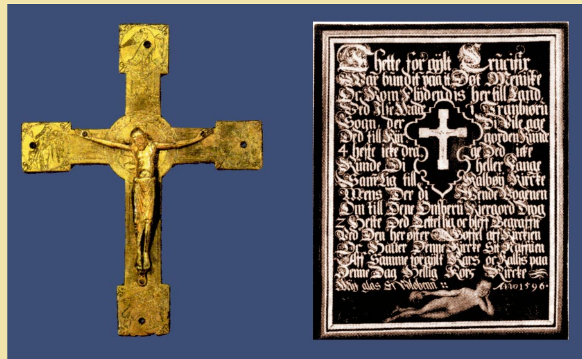
Det forgyldte middelalderkors og mindetavlen fra 1596 fra Onsbjerg kirke. Korset forefindes nu på Nationalmuseet.