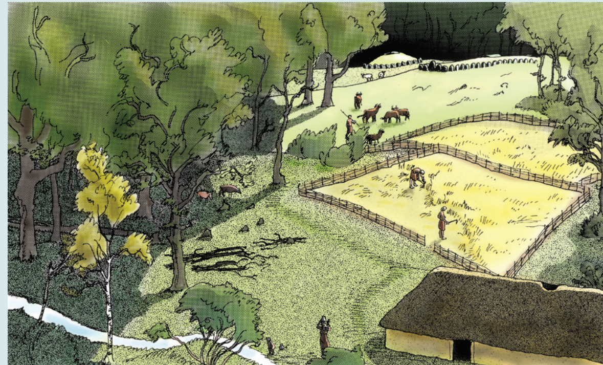
Et forsøg på rekonstruktion af hvordan der kunne have set ud her ved Kraneled for ca. 5.400 år siden. Bopladser med solide langhuse ligger i små rydninger sammen med primitive marker. I baggrunden Tragtbægerkulturens grave i lang- og runddysse. Tegning: Henrik Vester Jørgensen ©

Den asymmetriske placering af det synlige dyssekammer antyder, at den ganske velbevarede høj rummer flere træ- eller stenbyggede gravkamre, som måske blev tilføjet over tid gennem udvidelser af den oprindelige høj. Langs højens fod ses endnu størstedelen af de tætstillede randsten, som tydeligt markerer højen i landskabet.