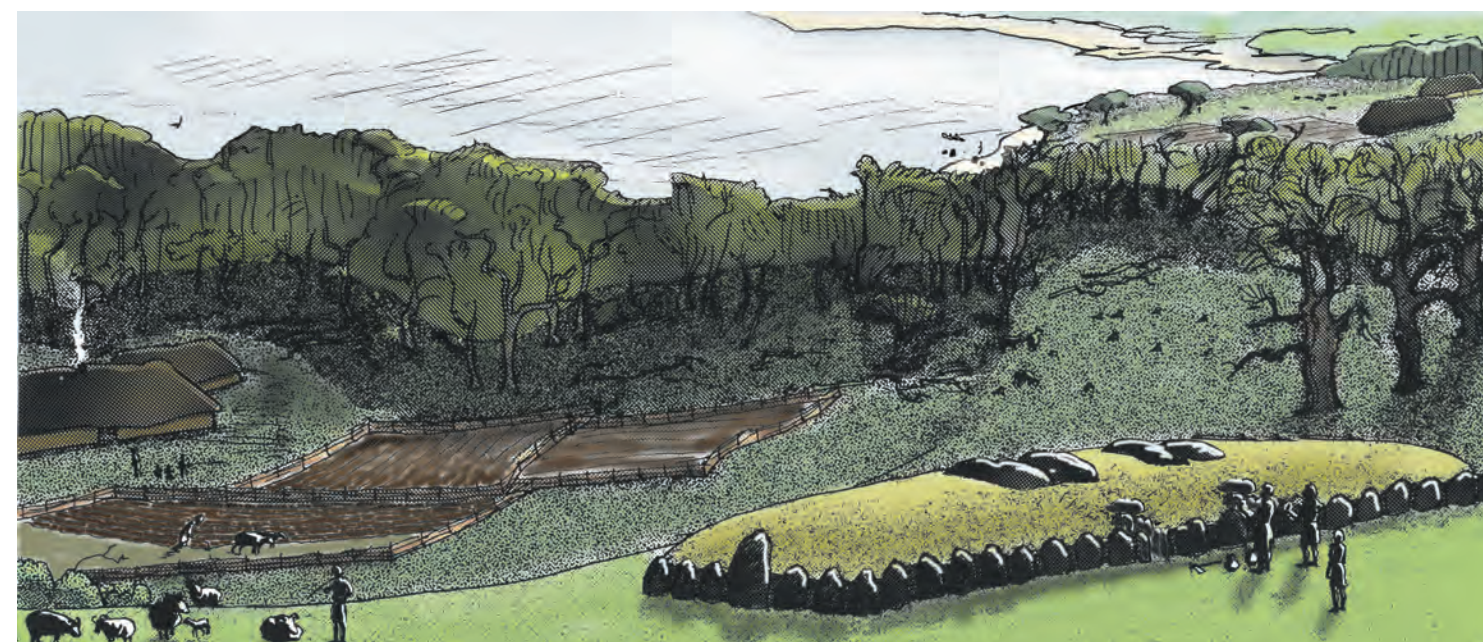
En fri rekonstruktionstegning af hvordan der kunne have set ud her ved Vielsted for ca. 5.400 år siden. Bopladser med solide langhuse ligger i små rydninger sammen med primitive marker. Med Tragtbægerkulturen grundlagdes bondesamfundet i Danmark. Skoven blev fældet med flintøkser til fordel for små marker og bebyggelsen blev mere permanent i form af solide langhuse. Hvor der var muligheder for det, supplerede man naturligvis stadig med jagt, fiskeri og indsamling.