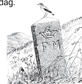
Tegning: Jens Bech © 1994

Fredning af fortidsminder Ud for langdyssen mod sydøst står en fredningssten med indhugget "F.M." for "Fredet Mindesmærke". Stenen angiver, at graven blev fredet frivilligt før Naturfredningsloven i 1937 beskyttede alle synlige fortidsminder. I Danmark har vi omkring 30.000 fredede fortidsminder, hvoraf langt størstedelen er gravmonumenter. Flertallet er gravhøje fra sten- samt bronzealderen og omkring 2.500 storstensgrave fra bondestenalderen er bevaret til i dag.